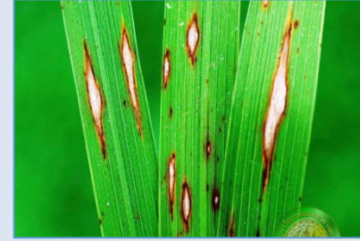
ระวัง! โรคน้ำขี้เถ้า

ความชื้นสัมพัทธ์ 65-85 % ความยาวนานแสงแดด 3-6 ชม.