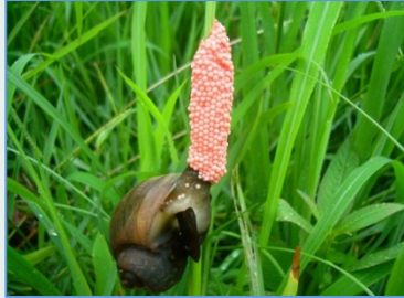
ระวัง! หอยเชอริ

ความชื้นสัมพัทธ์ 65-85 % ความยาวนานแสงแดด 3-5 ชม.