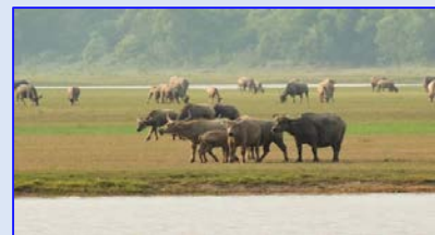
ไม่ควร! ปล่อยให้หญ้าในที่ชื้นแฉะนาน

ความชื้นสัมพัทธ์ 60-90 % ความยาวนานแสงแดด 3-6 ชม.