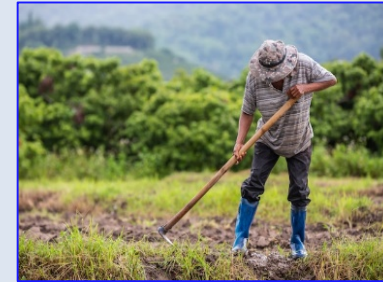
ควร! ทำทางระบายน้ำ

ความชื้นสัมพัทธ์ 70-90 % ความยาวนานแสงแดด 2-4 ชม.