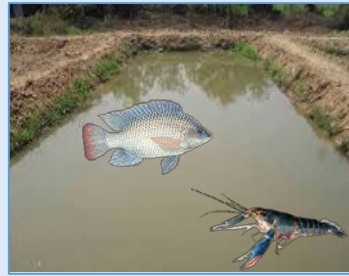
ควร! ยกขอบบ่อ