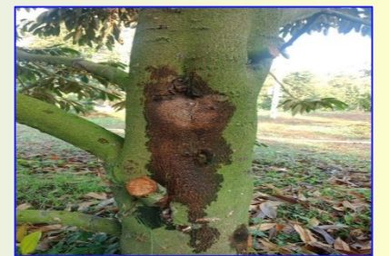
ระวัง! โรคน้ำขี้เถ้า