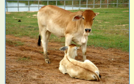
ไม่ควร! ปล่อยให้หญ้าในที่ชื้นแฉะ