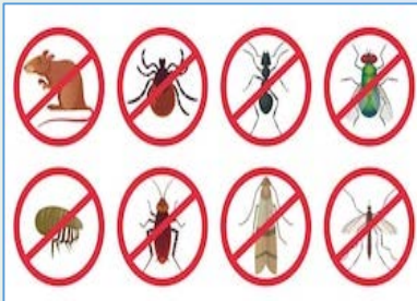
ระวัง! ศัตรูสัตว์

ความชื้นสัมพัทธ์ 60-80 % ความยาวนานแสงแดด 3-5 ชม.