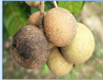
ระวัง! โรคน้ำขี้เถ้า