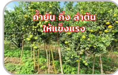
ระวัง อันตรายจากลมแรง