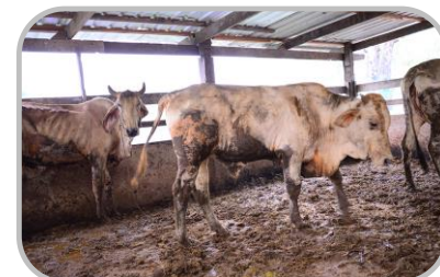
ไม่อยู่ในที่ชื้นแฉะ