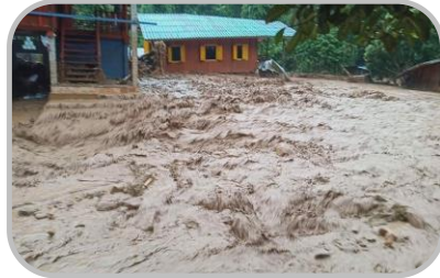
ระวัง อันตรายจากฝนตกหนัก

[21-26 / 28-35] ☀️ 4-7 ซม. : ความชื้นสัมพัทธ์ 80-90%