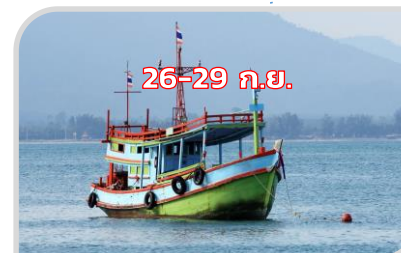
เดินเรือ ด้วยความระมัดระวัง