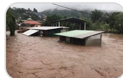
ระวัง อันตรายจากฝนตกหนัก

[20-26 / 28-36] ☀️ 3-6 ซม. : ความชื้นสัมพัทธ์ 75-85%