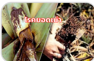
ระวัง โรคพืชที่เกิดจากเชื้อรา

[23-28/29-36] ☀️ 3-7 ซม. : ความชื้นสัมพัทธ์ 80-90%