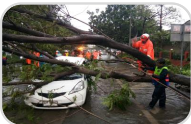
ระวังอันตรายจากลมกระโชกแรง