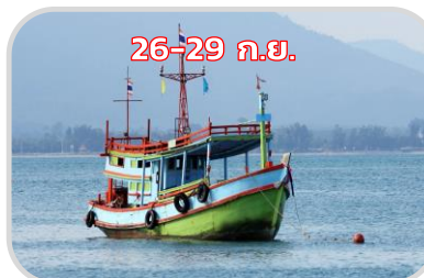
เดินเรือ ด้วยความระมัดระวัง