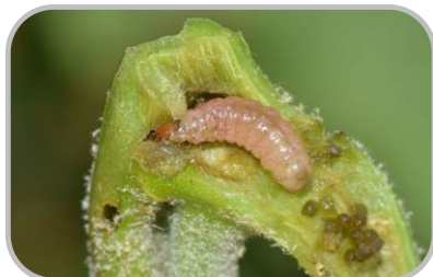
ระวัง ศัตรูพืชจำพวกหนอน

[22-27 / 30-36] ☀️ 3-7 ซม. : ความชื้นสัมพัทธ์ 80-90%