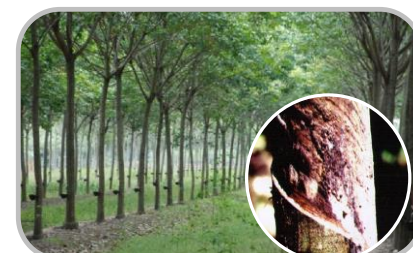
ระวัง โรคพืชที่เกิดจากเชื้อรา

[22-27 / 30-36] ☀️ 4-7 ซม. : ความชื้นสัมพัทธ์ 75-85%